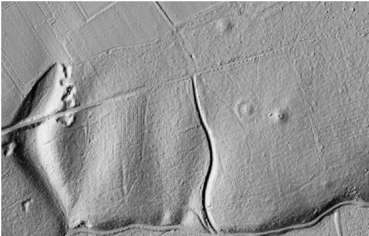
Afbeelding 4: uittreksel uit het Digitaal Hoogtemodel DHM: drie grafheuvels en een holle weg. Uiterst links de Duivelsputten - een oude erosiegeul (Geopunt).

Je keert terug naar waar je vandaan kwam en gaat op de kruising schuin rechts. Je verlaat hier dus de Nieuwendreef. Kom je in een holle weg terecht? Draai dan 180 graden: je bent in de verkeerde richting gegaan. Loopt de weg zachtjes omhoog naar een grote open ruimte met akkers en paardenweiden? Dan heb je de juiste weg gevonden! Kies een plekje vanwaar je goed zicht hebt op de omgeving. Dit is jouw stopplaats 7 .