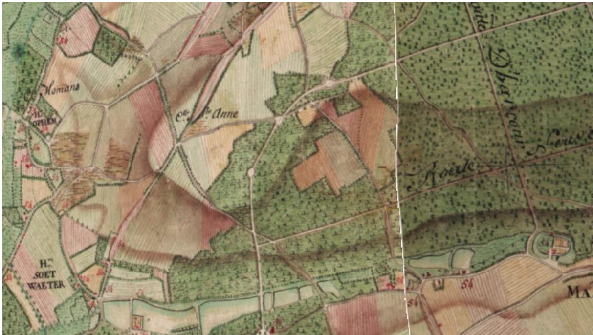
Afbeelding 1: het Soet Waeter en een deel van Heverleebos op de Ferrariskaart, 1771-1778.

🔊 Proloog. Een veel te lange inleiding op de geschiedenis van het bos.