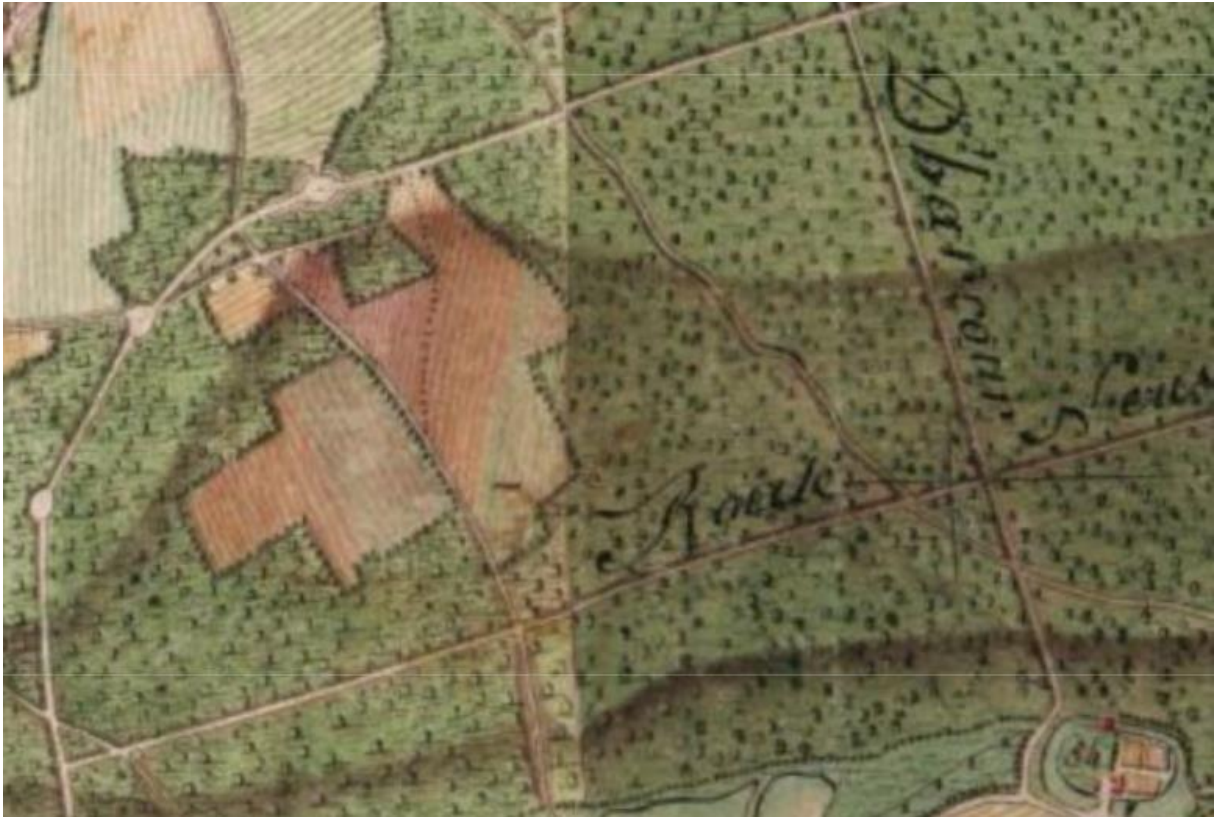
Afbeelding 5: de 'Grote Rooij' in Heverleebos op de Ferrariskaart, 1771-1778. Rechts beneden het kasteel van Harcourt. Vind je de Pragenstraat en de Lijkenweg?.

Loop verder omhoog. Het pad wordt een holle weg. Bovenaan kruis je een bospad. Loop nog even rechtdoor tot je een brede dreef kruist met een bareel op links. Hier sla je rechtsaf. Na zowat 100 meter sta je bovenop een kleine heuvel met diepe grachten aan weerszijden en een wit informatiebord op de top. Je hebt de laatste halte gevonden, stopplaats 8 .