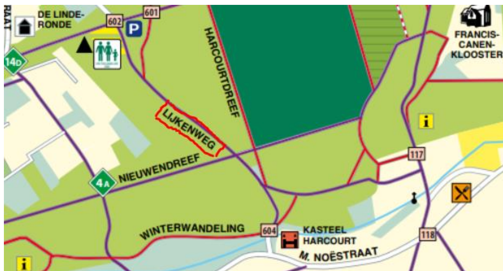
Afbeelding 3: uittreksel uit de wandelkaart van ANB

Je volgt verder de Nieuwendreef. Na 500 meter kom je opnieuw op een kruising. Links loopt er een holle weg de heuvel af. Die moet je niet nemen, maar links van die holle weg gaat een smal pad het bos in. Daar wacht je een verrassing, en ook stopplaats 6 .